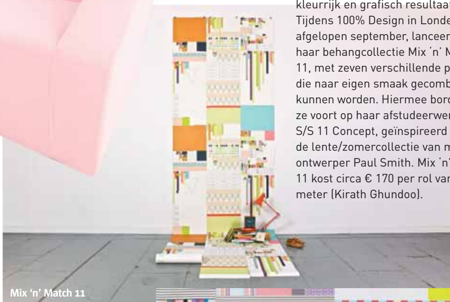
Mix 'n' Match 11

Bank Blur van de Amerikaanse ontwerper Marc Thorpe valt op door de bekleding die van fel rood naar bijna wit vervaagt – mogelijk door een nieuwe weeftechniek –, waardoor de bank aan de lichte zijde in het niets lijkt op te lossen. Ideaal voor kleine ruimtes! Voorsnog een prototype (Moroso).