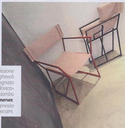
La nuova collezione di sedute pieghevoli Xenia disegnata da Ludovica+Roberto Palomba per Eumenes , in mostra presso Clan Upstairs.

Presso la Galleria Acheo di via Fiori Chiari, l'azienda catalana Marset presenta il suo nuovo catalogo di illuminazione. Sulla parete, le lampade Concentric di Rob Zinn. A soffitto e nella versione da tavolo, la lampada Ginger di Joan Gaspar.