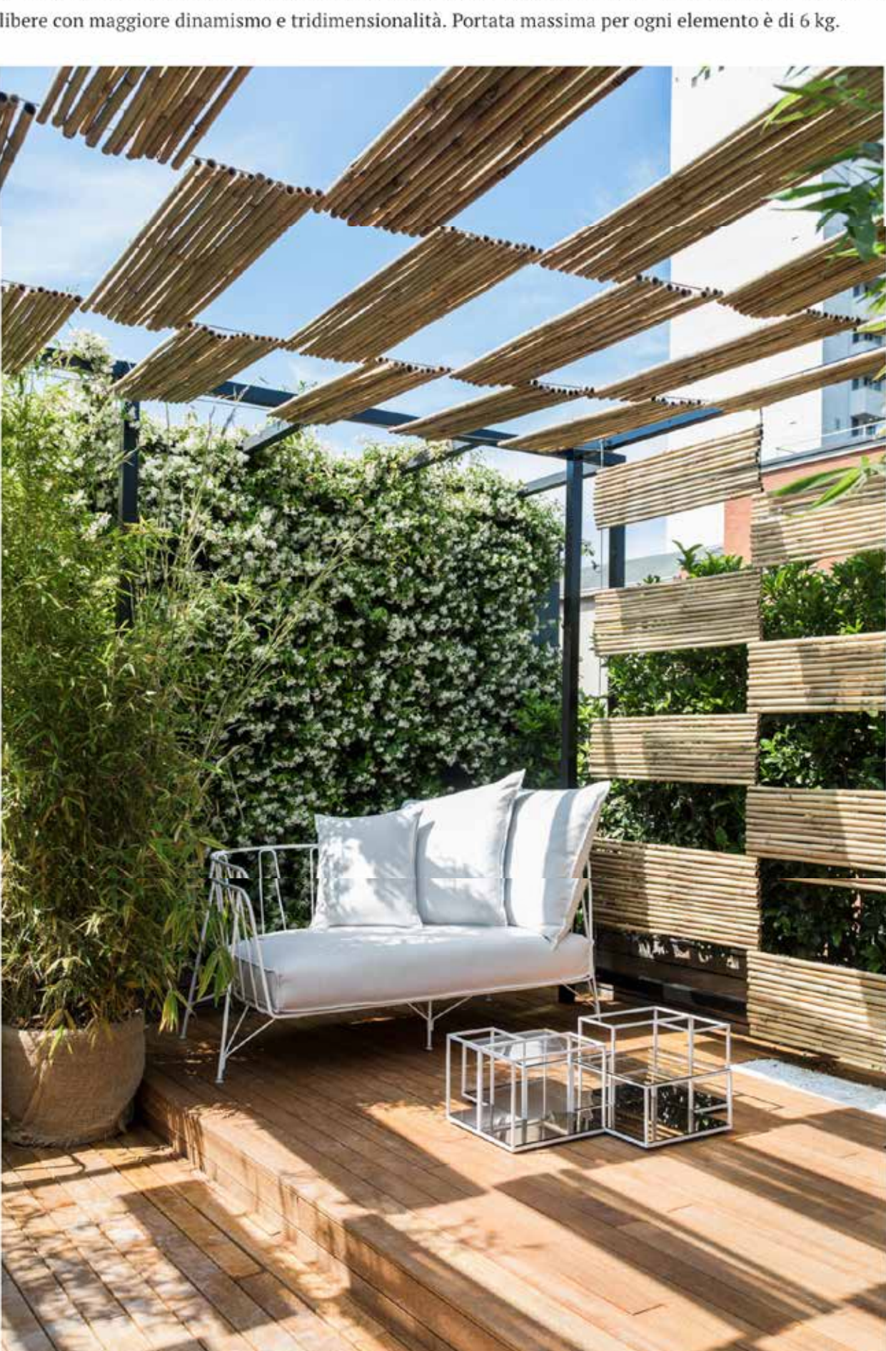
I moduli Koros, nella versione a terra, Elin Hedberg designer per Eumenes, associati a Eu/canistro

Koros è infine un sistema modulare, disegnato da Elin Hedberg, composto da parallelepipedi realizzati con un'avanzata tecnica di estrusione e pressofusione di alluminio. Le strutture volumetriche conferiscono al prodotto leggerezza, resistenza ed eleganza. I singoli elementi si prestano a un uso informale e personalizzabile in due pratiche versioni: Koros a terra e Koros a parete. Nella versione a terra, nove sono i moduli self standing disponibili, tutti dotati di un piano di appoggio inferiore. Nella versione a parete invece, i moduli disponibili sono otto, dotati anche in questo caso di un piano d'appoggio inferiore oltre che di un sistema di aggancio a muro. La profondità di ciascun parallelepipedo è di 180 mm, tranne che per uno da 270 mm che ne consente composizioni libere con maggiore dinamismo e tridimensionalità. Portata massima per ogni elemento è di 6 kg.