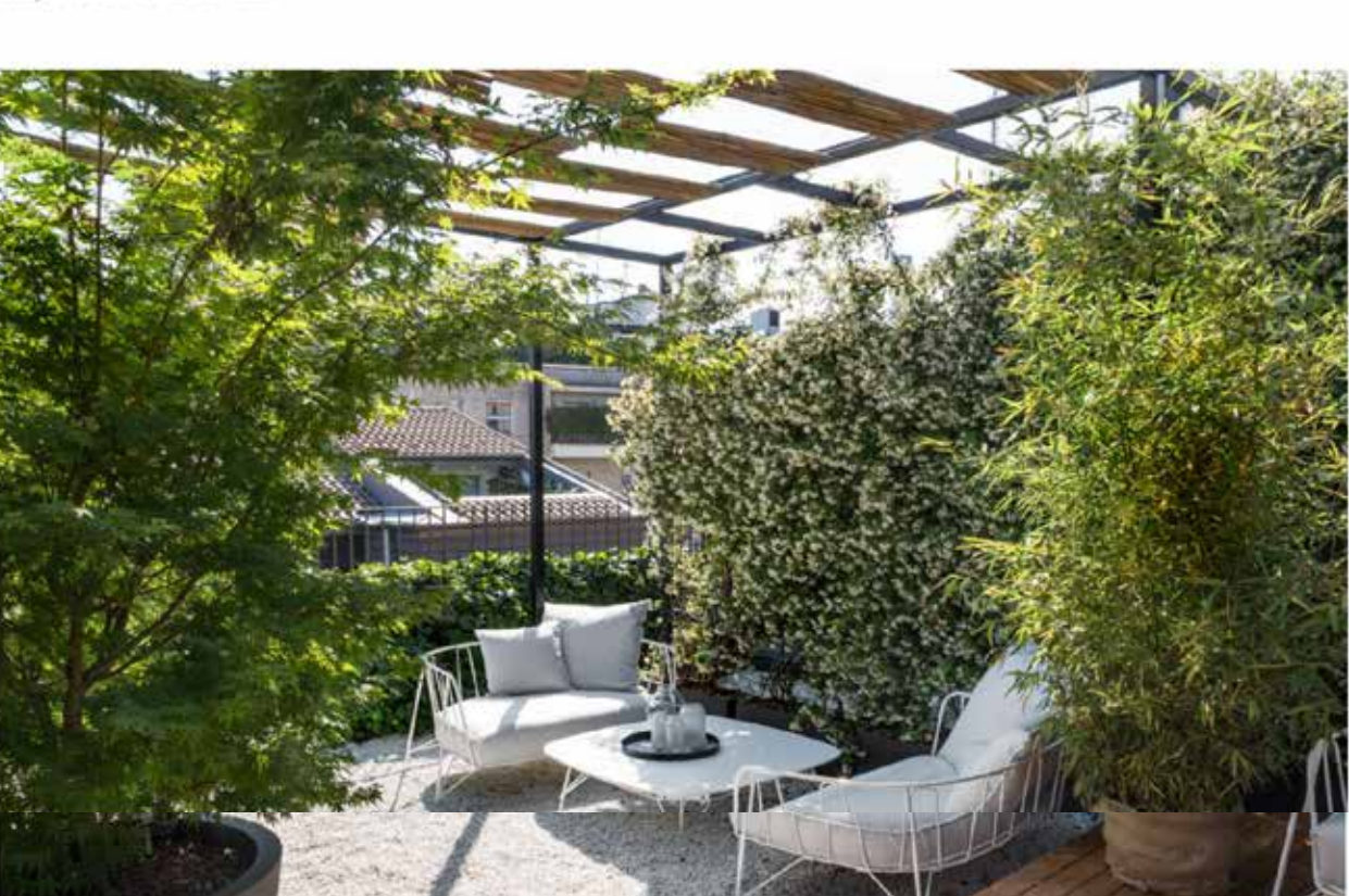
Il tavolo Eus, Paola Navone designer per Eumenes

Elemento caratterizzante è però il piano che, disponibile in cristallo acidato, in stratificato Abet Laminati, in MDF bianco o ancora in Valchromat®, un innovativo pannello di fibre di legno tinto in massa con coloranti organici, ne cambia di volta in volta l'impatto estetico oltre che la predisposizione all'impiego in ambienti interni o outdoor. Prodotto in versione rettangolare nelle misure 205 x 105 cm e 250 x 105 cm, e quadrato da 115 cm; è disponibile in due versioni: alto, da 72 cm, e basso da 35 cm.