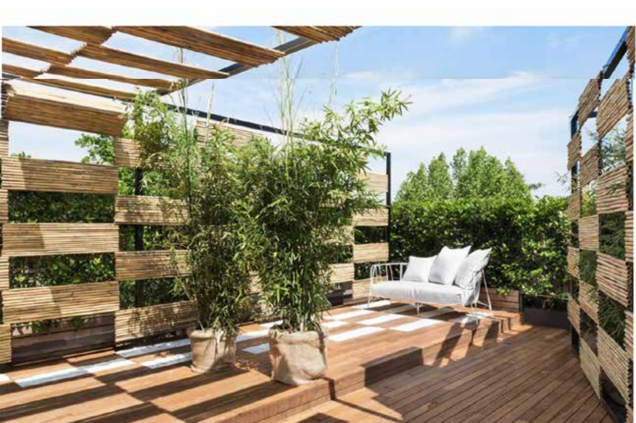
Al centro dell'immagine, il divano Eu/canistro disegnato da Paola Navone per Eumenes

Eu/canistro è il divano disegnato da Paola Navone , in foto in versione color bianco, il cui stile contemporaneo è evidenziato dalla struttura tubolare in acciaio inox verniciato a polvere, accorgimento che ne garantisce una migliore resistenza agli agenti atmosferici esterni nella sua versione outdoor. La seduta, soffice e accogliente, si presta a un'ampia personalizzazione per materiali e colori a seconda della versione in/outdoor. I cuscini di appoggio posteriori, disponibili in due misure, possono essere scelti indifferentemente per quantità, dimensioni, colore e tessuto. Lo schienale ripercorre infine, il tratto decorativo "a trave" del tavolo Eus che nell'allestimento di Lavit è impiegato nella sua versione bassa da 35cm.